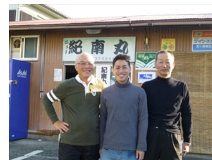
(海の風を浴びて満足です)