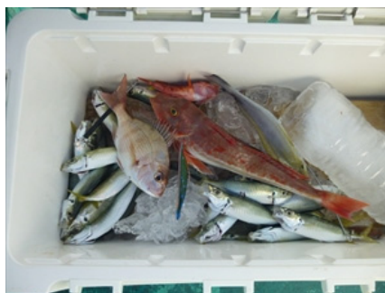
(馬渡さんのクーラーボックス)