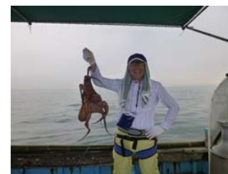
永末もこの日最大の3.5kgを手自慢のポーズです！！