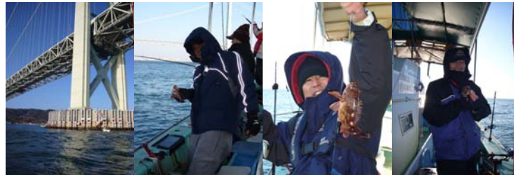
ご覧のように明石大橋の橋脚付近でもフィッシングです 戦場ならぬ船上カメラマンはこのあとデジカメ故障で写っていません