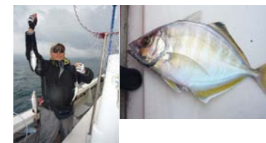
永末:アジ3連荘ときれいなカイワリ