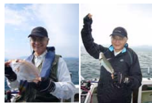
中馬さん:レンコダイにアジをゲット こまでは順調でしたが・・・