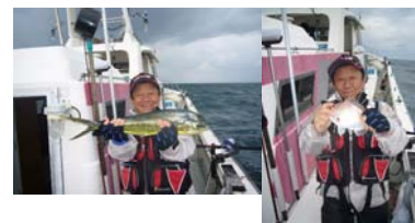
納見さん:マダイにシイラ *シイラのせいで仕掛けはグチャグチャ